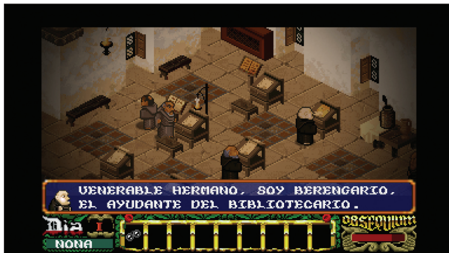
Guillermo de Occam en la biblioteca. La Abadía del Crimen.