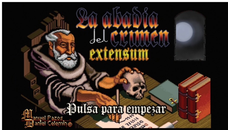
La Abadía del Crimen. Inicio de partida.