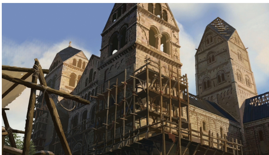
La catedral de Kingsbridge en construcción. Los Pilares de la Tierra.

una aventura gráfica point & click en dos dimensiones que permite seguir la novela de manera interactiva, ya que los momentos cinemáticos son numerosos y te acompañan hasta completar los tres "libros" con sus respectivos siete capítulos que componen cada uno de ellos, para concluir con un final acorde con el deseo original del narrador inglés, que, al contrario que en el caso de Umberto Eco, aquí también colabora como ya lo hizo en la serie de televisión sobre su novela, tal y como hemos aludido con anterioridad. La banda sonora, incluida en la edición coleccionista, acompaña perfectamente al desarrollo de la trama 15 , y es parte esencial de su calidad final.